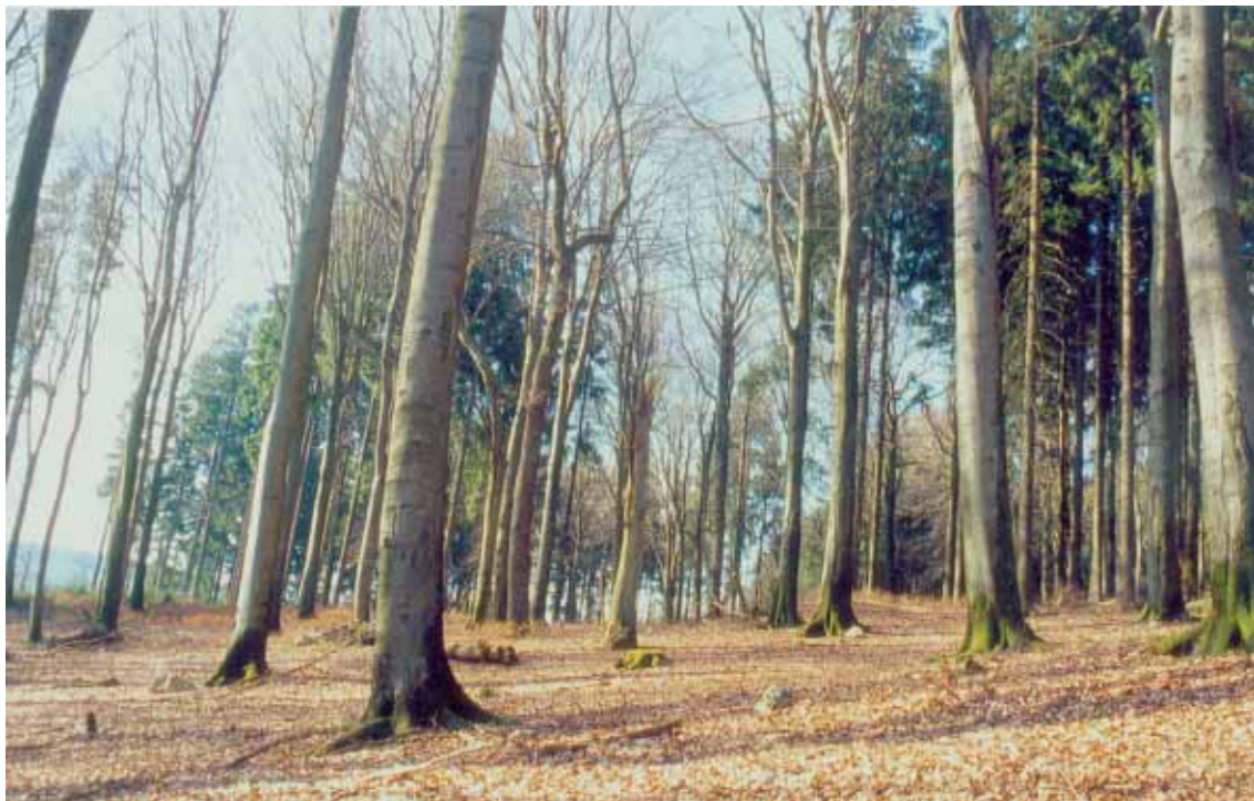
Abb. 1: Fotografien des Bestandes in der Kernfläche des Naturwaldreservates Gebück (Forstamt Birkenfeld)

Im Berichtsjahr wurde die Kernfläche waldkundlich aufgenommen. Die Kenndaten zum Naturwaldreservat und zur Kernfläche sind der Tabelle 1 zu entnehmen.